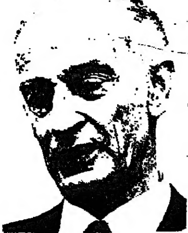
بقلم: يعقوب شمعوني

عندما اعلن لاول مرة قبل بضعة اسابيع ان سوريا تطلب ارجاء موعد انعقاد مؤتمر القمة العربية الذي تقرر انعقاده في عمان في اواخر شهر نوفمبر، لم يتصور المرء ان يبلغ الامر درجة انعقاد المؤتمر بدون سوريا، ودرجة مقاطعتها من قبل خمس دول بالاضافة الى المنظمة. لقد تصور اكثر المرء ان يكون هذا الخلف كذلك، والذي قد يكون تكتيكيا، سيتم التوصل الى تسوية، كما يتم التوصل الى مثل هذه التسويات بالنسبة لخلافات كثيرة اخرى (ذلك ان الحياة السياسية تقوم على خلافات وتسويات دائبا). فاما ان تراجعت سوريا عن معارضتها، او ان انعقاد المؤتمر القومي سيرا بناء على طلبها.